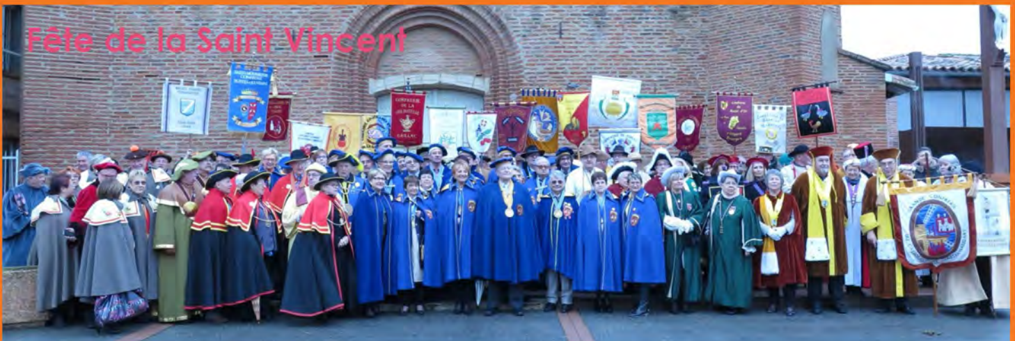
Fête de la Saint Vincent