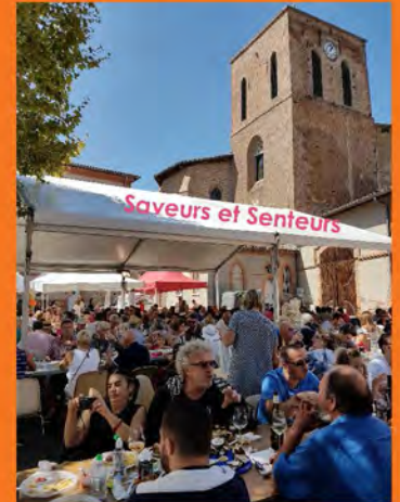
Saveurs et Senteurs