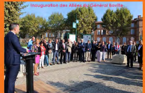
Inauguration des Allées du Général Bovilla