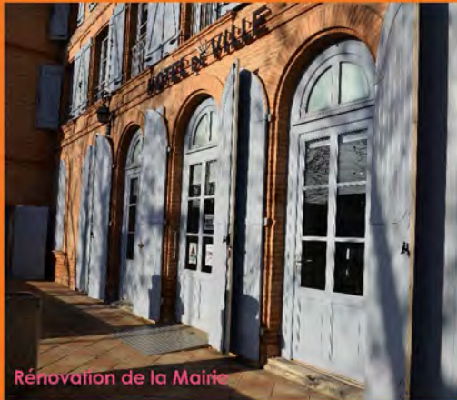
Rénovation de la Mairie