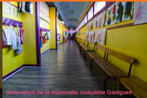
Rénovation de la maternelle Joséphine Garrigues