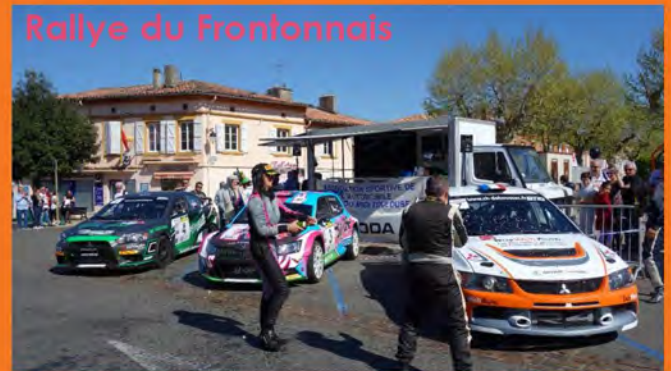
Rallye du Frontonnais