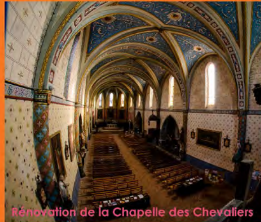
Rénovation de la Chapelle des Chevaliers