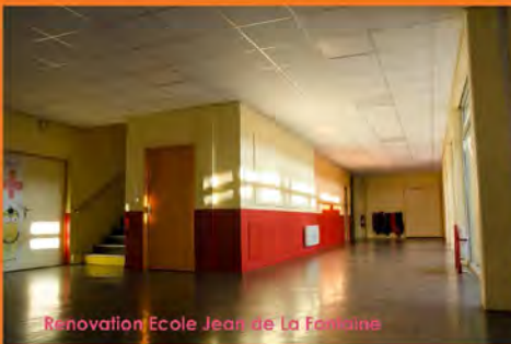
Rénovation Ecole Jean de La Fontaine