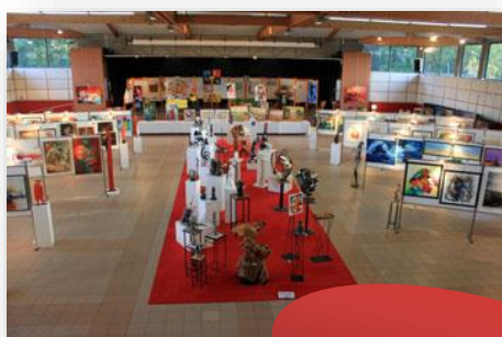
Espace Gérard Philipe