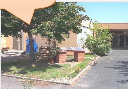
Ecole et ALAE élémentaire Jean de la Fontaine