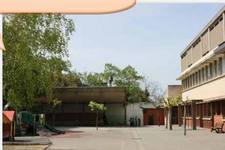
Ecole et ALAE maternelle Joséphine Garrigues