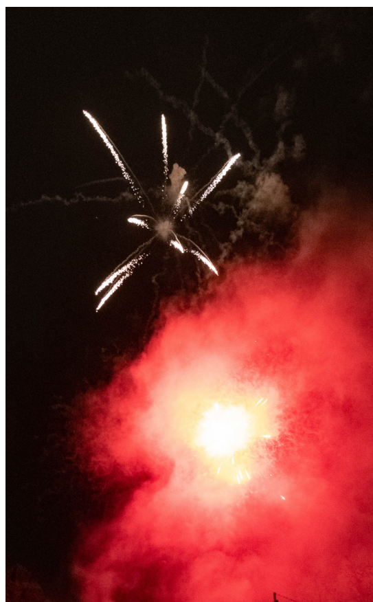
Un impressionnant feu d'artifice a donné le départ à la soirée gourmande du Marché de Noël !