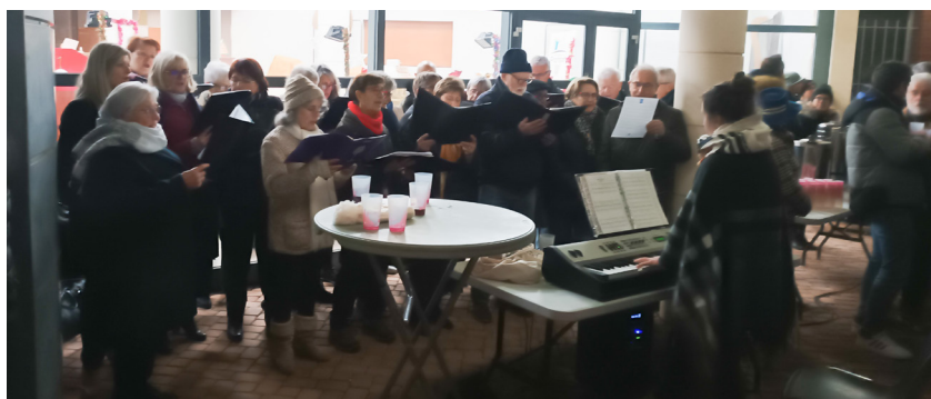
La Chorale Castel Cantorum chante des chansons de Noël.