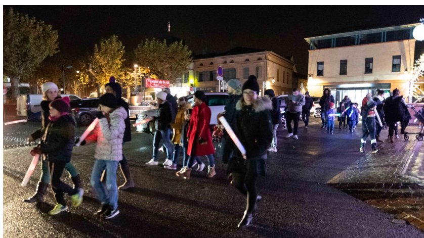
Le convoi lumineux des enfants munis de flambeaux LED offerts par la Mairie est descendu de la Halle au Marché de Noël. Du chocolat chaud les attendait à l'arrivée