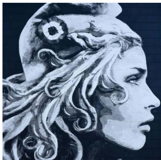
Marianne, par Yseult Digan, Yz

La liberté de conscience et d'opinion et la liberté d'expression sont la condition nécessaire pour que chaque citoyen puisse former son jugement de manière éclairée et participer pleinement à la vie publique.